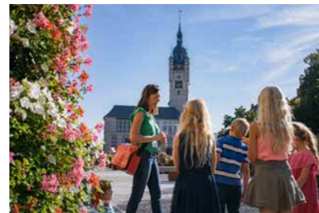
Stadtrundgang für Schulklassen