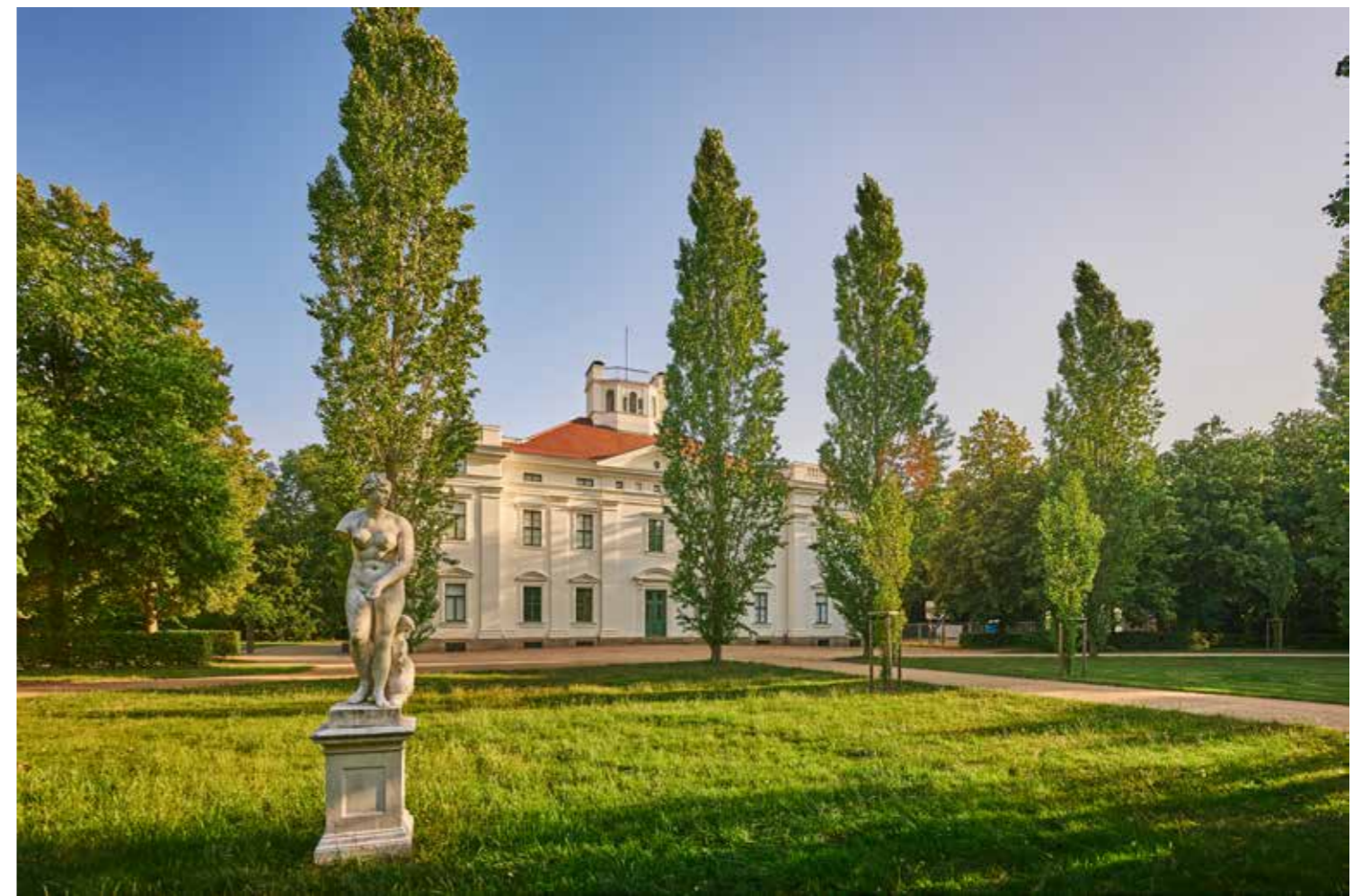
Schloss Georgium, Sitz der Anhaltischen Gemäldegalerie Dessau