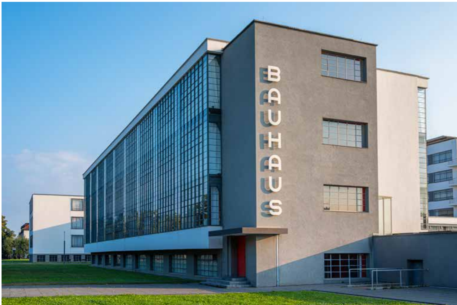
Ikone der Moderne: Das Bauhausgebäude in Dessau

Viel Freude beim Entdecken unserer vielfältigen Angebote. Für all Ihre Fragen stehen wir Ihnen gerne zur Verfügung. Wir freuen uns auf Ihren Besuch!