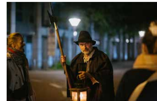
Event-Rundgang mit dem Nachtwächter