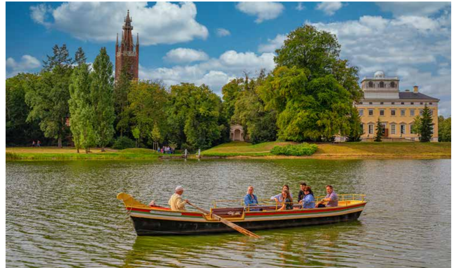
Eine Gondelfahrt im Wörlitzer Park