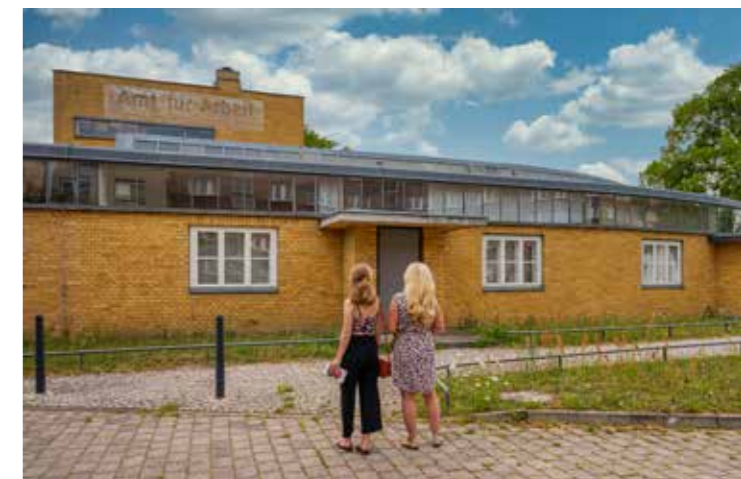
Das Historische Arbeitsamt